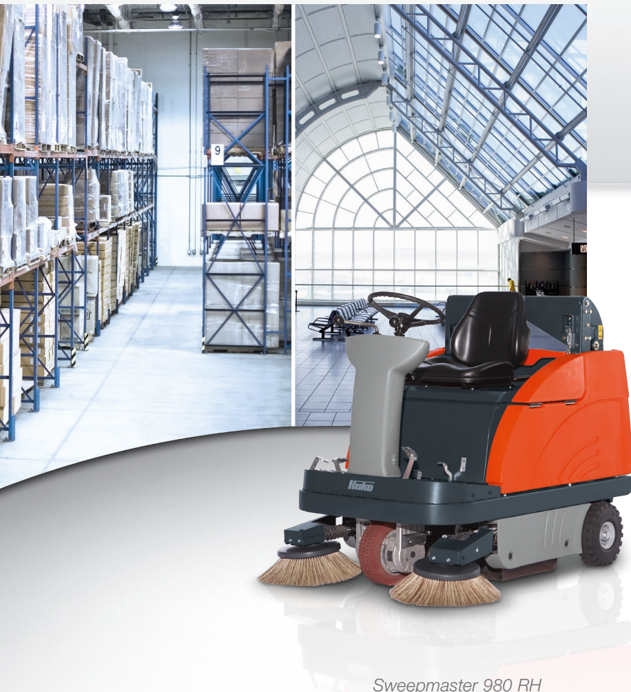
Sweepmaster 980 RH

Wydajność powierzchniowa do 7 200 m 2 /h