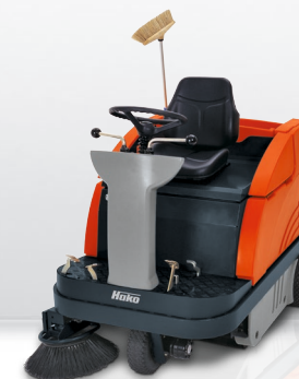
Sweepmaster P980 R

Zamiatarki przemysłowe z operatorem siedzącym