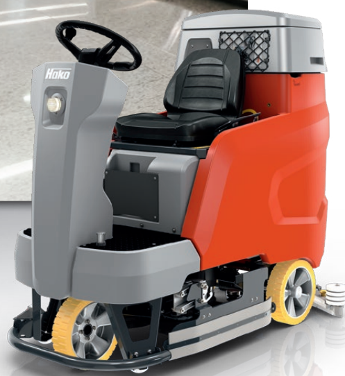
Scrubmaster B120 R

Zwiększona wydajność powierzchniowa i doskonała manewrowość: Scrubmaster B120 R został zaprojektowany z myślą o sprzątaniu centrów handlowych, hal produkcyjnych oraz obiektów z dużym przepływem ludzi, takich jak dworce i lotniska. Ze swoim 120-litrowym zbiornikiem oraz w połączeniu z czterema różnymi szerokościami roboczymi maszyna gwarantuje szybkie i wydajne czyszczenie dużych i średnich powierzchni. Co więcej, kompaktowe wymiary i 90-stopniowy kąt skrętu kierownicy sprawiają, że jest bardzo zwrotna i uniwersalna. Maszyna może być wyposażona w szczotki tarczowe lub walcowe, co pozwala zaadaptować ją do indywidualnych wymagań klienta. Scrubmaster B120 R zapewnia operatorowi idealne miejsce pracy: ergonomicznie zaprojektowane, z detalami ułatwiającymi wydajną pracę.