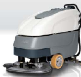
Hakomatic B 70 CLH / 90 CLH