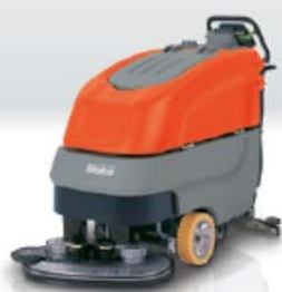
Hakomatic B 70/CL