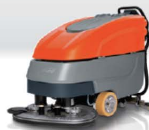
Hakomatic B 120