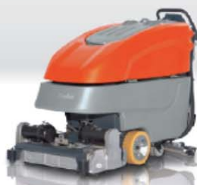
Hakomatic B 90/CL