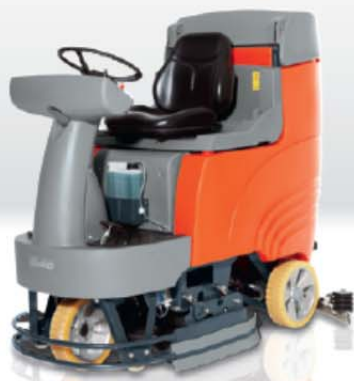
Hakomatic B 115 R szczotki tarczowe (TB)