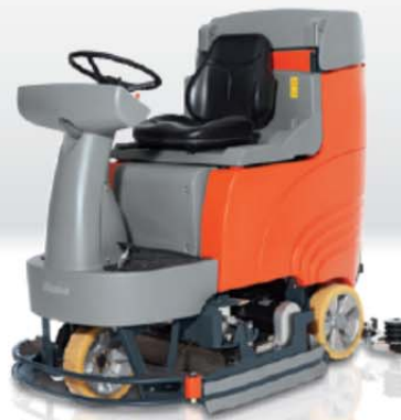
Hakomatic B 115 R szczotki walcowe (WB)